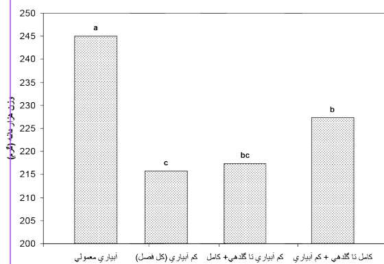
شکل ۳- اثر روش آبیاری بر وزن هزار دانه (میانگین های دارای حروف مشابه از نظر آماری اختلاف ندارند (دانکن \alpha=0/01 )).

** و * به ترتیب معنی داری در سطح ۱ و ۵ درصد n=48